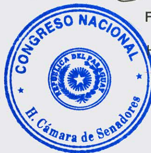
Fernando Lugo Méndez Presidente H. Cámara de Senadores